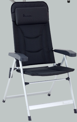
LOKE HIGH BACK 700006245