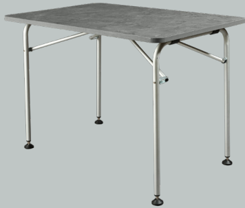
ULTRALEICHT-CAMPINGTISCH 140 X 90 CM 700006275 120 X 80 CM 700006274 100 X 68 CM 700006276