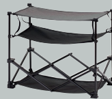
AUFBEWAHRUNGSSCHRANK "SINGLE" 700006256