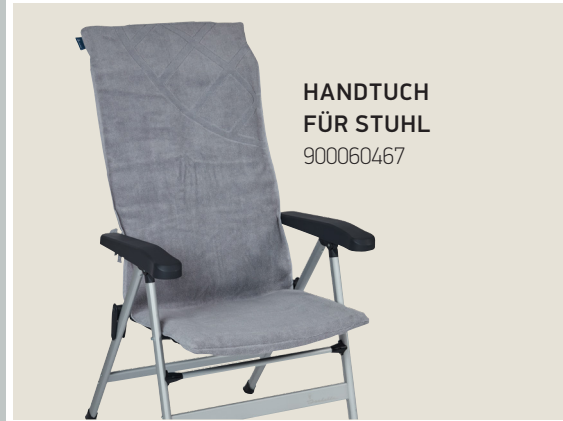
HANDTUCH FÜR STUHL 900060467

Passend für nahezu alle Isabella Stühle (ab Modell 2018)