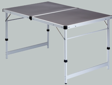
KLAPPTISCH 120 X 80 CM 700006229 120 X 60 CM 700006271