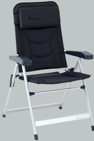
LOKE LOW BACK 700006244