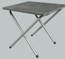
BEISTELLTISCH 50 x 40 CM 700006277